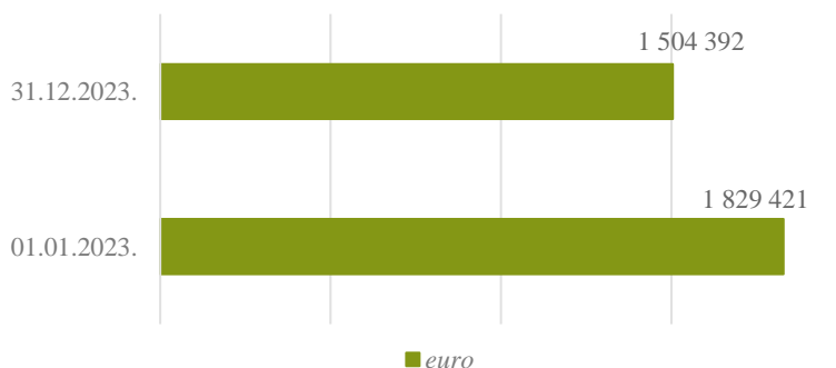
2. attēls. CVK bilances kopsumma pārskata perioda sākumā un beigās, euro

CVK 2023. gada pārskats visos būtiskajos aspektos sniedz skaidru un patiesu priekšstatu par CVK finansiālo stāvokli, tā izmaiņām un CVK darbības rezultātiem gadā, kas noslēdzās 2023. gada 31. decembrī, un tas ir sagatavots atbilstoši Latvijas Republikā spēkā esošo normatīvo aktu prasībām.