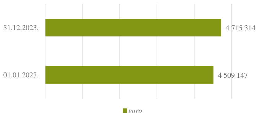
2. attēls. Resora "Ministru kabinets" bilances kopsumma pārskata perioda sākumā un beigās, euro