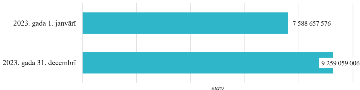
3. attēls. Labklājības ministrijas bilances kopsumma pārskata perioda sākumā un beigās, euro

Labklājības ministrijas bilances kopsumma pārskata gadā ir palielinājusies un pārskata gada beigās ir 9 259 059 006 euro (3. attēls).