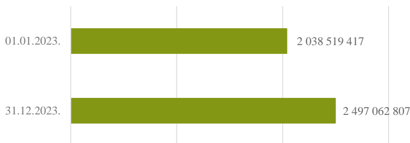
2. attēls. Aizsardzības ministrijas bilances kopsumma pārskata perioda sākumā un beigās, euro